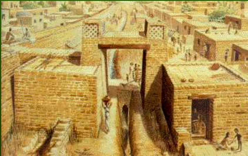
Улицы Мохенджо- Даро

Рассмотрите результаты раскопок. Какие выводы о жизни городов Мохенджо-Даро и Хараппа можно сделать?